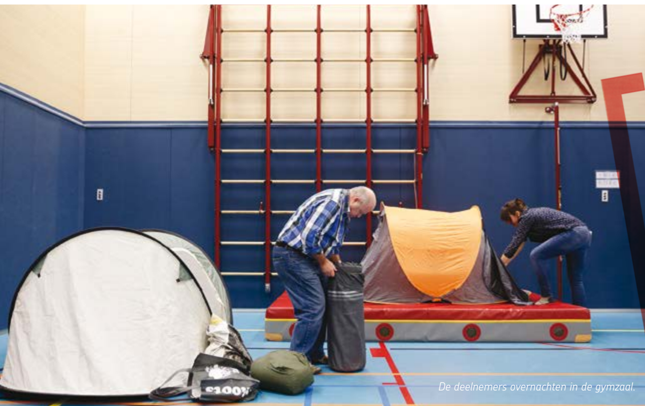
De deelnemers overnachten in de gymzaal.