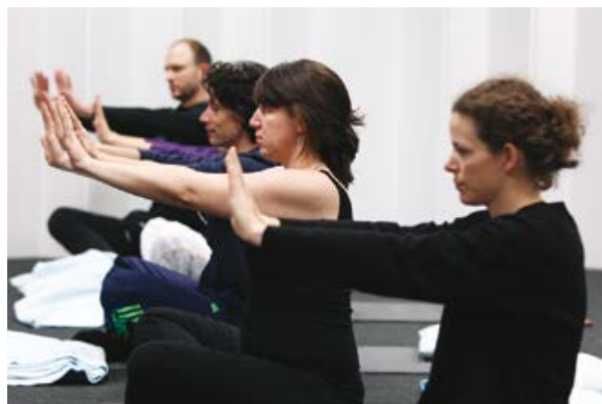
> Workshop yoga op De Hef.

‘De vorm van de 24 uur doorbrak de neiging om in onze expert-rollen te vervallen’