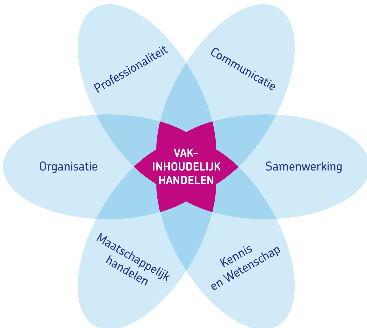
Figuur: Het CanMEDS-model.