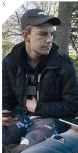
Cover: Filmscène uit 'Ik ben geen probleemkind...'